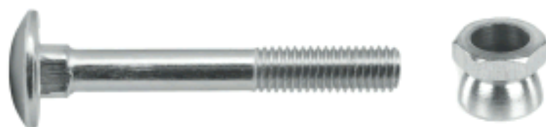
Антивандальный болт и гайка

Для торцевых и угловых секций разработаны специальные хомуты.