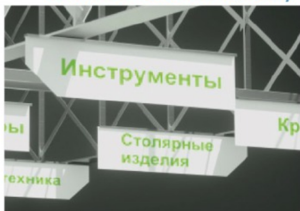
Указатели и вывески / Көрсеткіштер мен белгілер