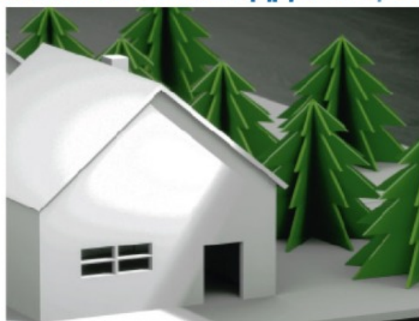
Создание поделок и декупажа / Қолөнер мен декупаж жасау