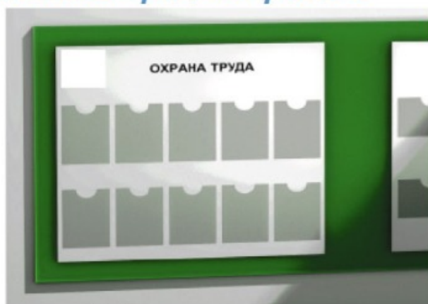
Информационные стенды / Ақпараттық стендтер